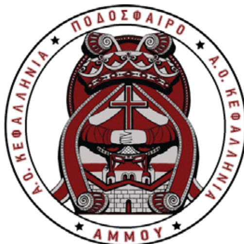
Το Επίσημο Σήμα της Ομάδος