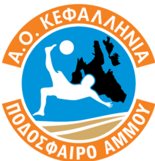
Το Ευρωπαϊκό Σήμα της Ομάδος

■ Καταρτίζεται επίσημος πίνακας παρατηρητών αγώνων ο οποίος θα τεθεί σε ισχύ στη νέα αγωνιστική περίοδο, εφόσον βεβαίως βοηθήσουν και τα σωματεία.