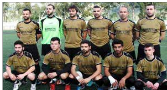
Α.Ε. ΚΕΦΑΛΛΗΝΙΑΣ - Πρωταθλητές Α' Κατηγορίας

Τα Πρωταθλήματα μας ολοκληρώθηκαν και έχουμε ήδη τους Πρωταθλητές περιόδου 2012-2013. Στην Α' κατηγορία Πρωταθλητής αναδείχθηκε η ομάδα Α.Ε. ΚΕΦΑΛΛΗΝΙΑΣ που απέκλεισε στα μπαράζ την ομάδα του Α.Ο.Κ.Ι. Αντίστοιχα στη Β' Κατηγορία Πρωταθλητής περιόδου αναδείχθηκε η ομάδα των Α.Ο. ΦΩΚΑΤΩΝ που απέκλεισε στα μπαράζ την ομάδα των Α.Ο. ΠΡΟΝΝΩΝ. Στο επόμενο τεύχος θα ακολουθήσει αναλυτικό αφιέρωμα!