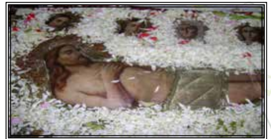
Ο Επιτάφιος του Μητροπολιτικού Ναού Αργοστολίου

Στην Κεφαλονιά τελείται από χρόνια το απόγευμα της Κυριακής στο Μητροπολιτικό Ναό μόνο και νωρίτερα στο Μοναστήρι του Αγίου Γερασίμου, ο Εσπερινός της Αγάπης κατά διάρκεια του οποίου διαβάζεται το Ευαγγέλιο στα Ελληνικά, Λατινικά καθώς και άλλες γλώσσες.