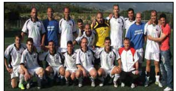
Α.Ο. ΦΩΚΑΤΑ - Πρωταθλητές Β' Κατηγορίας