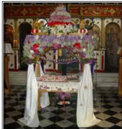
Ο Επιτάφιος του Αγ. Ελευθερίου Αργοστολίου

Σήμερα λαμβάνει χώρα η προσκύνηση του εσταυρωμένου Χριστού. Η ακολουθία τελειώνει περίπου γύρω στις 12:30 και αμέσως οι γυναίκες ξεκινούν το στόλισμα του Επιταφίου. Ο Επιτάφιος στολίζεται με διάφορους τρόπους και με μεγάλη ποικιλία λουλουδιών. Παλαιότερα «συναντιόνταν» όλοι οι Επιτάφιοι της πόλεως στη πλατεία, με αποτέλεσμα ο συναγωνισμός να είναι μεγάλος. Και αυτό το καταργήσαμε δυστυχώς. Σε όλους όμως τους Ναούς γίνεται μικρή περιφορά των επιταφίων ενώ στο Ληξούρι από πέρυσι, ευτυχώς ξανάρχισε η κοινή λιτανεία των επιταφίων.